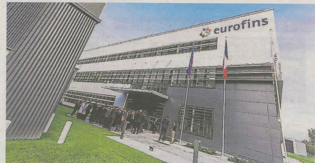
Eurofins a agrandi de 9 500 m 2 son site à Nantes.

Le laboratoire spécialisé dans l'analyse d'aliments a agrandi de 9 500 m 2 son site à Nantes.