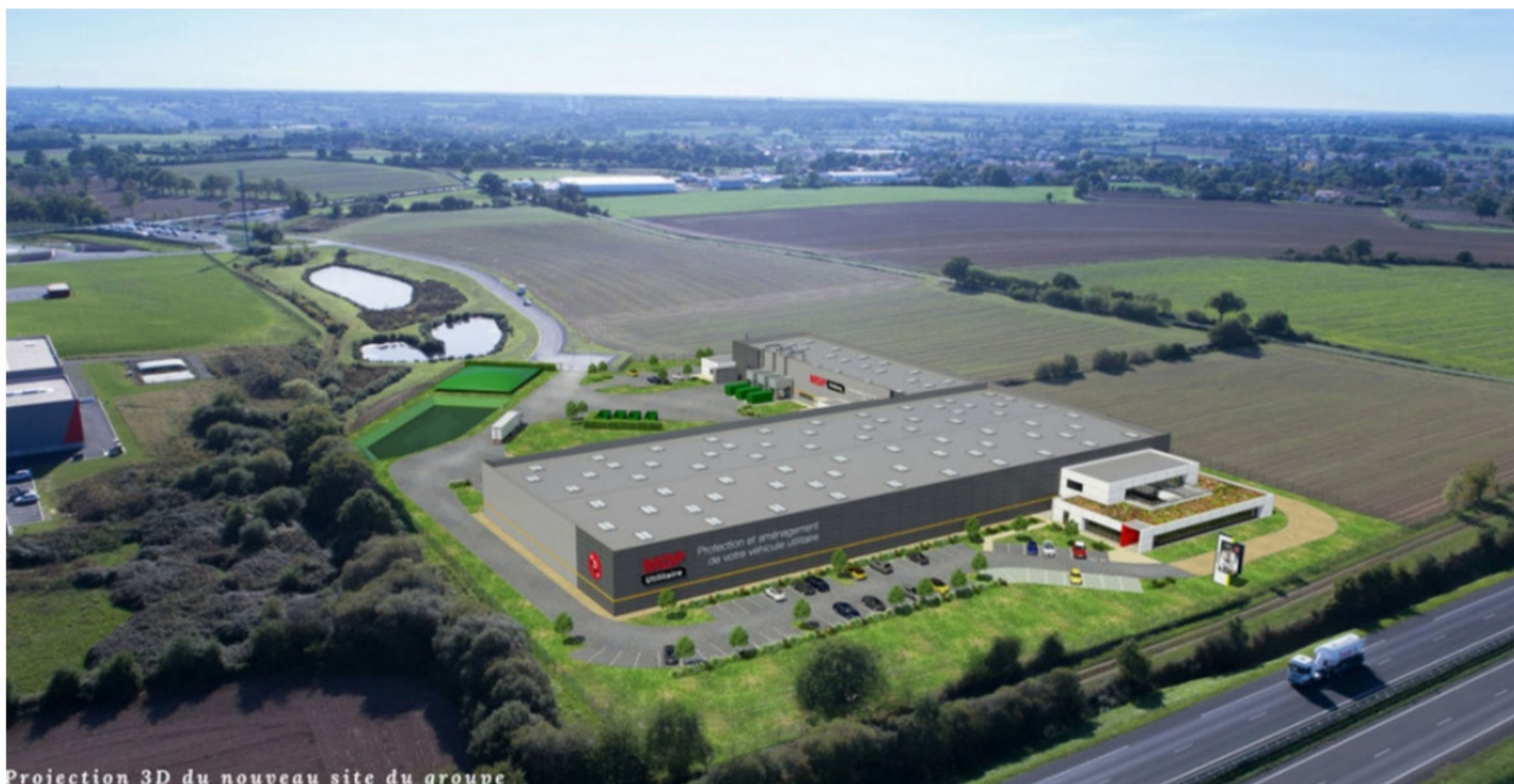
Projection 3D du nouveau site du groupe

Fabriqués en France, dans la région de Nantes, les aménagements et protections conçus par MDP Utilitaire ont pour mission d'équiper et sécuriser les véhicules utilitaires professionnels.